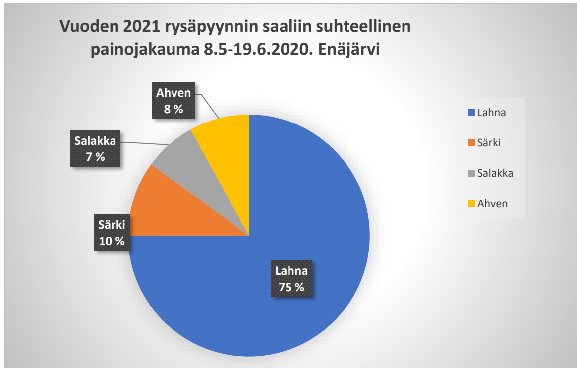
Kuva 1. Rysäpyyntijakso 1 Enäjärvellä. Kokonaissaaliin suhteellinen painojakauma.

Kuvassa 1 on esitetty saalisjakauma huomioiden vapautetut arvokalat. Saalisjakauma tukee vuoden 2019 koekalastuksen tuloksia. Valtalajina on pasuri ja lahna. Petokalakanta on Enäjärvessä hyvä.