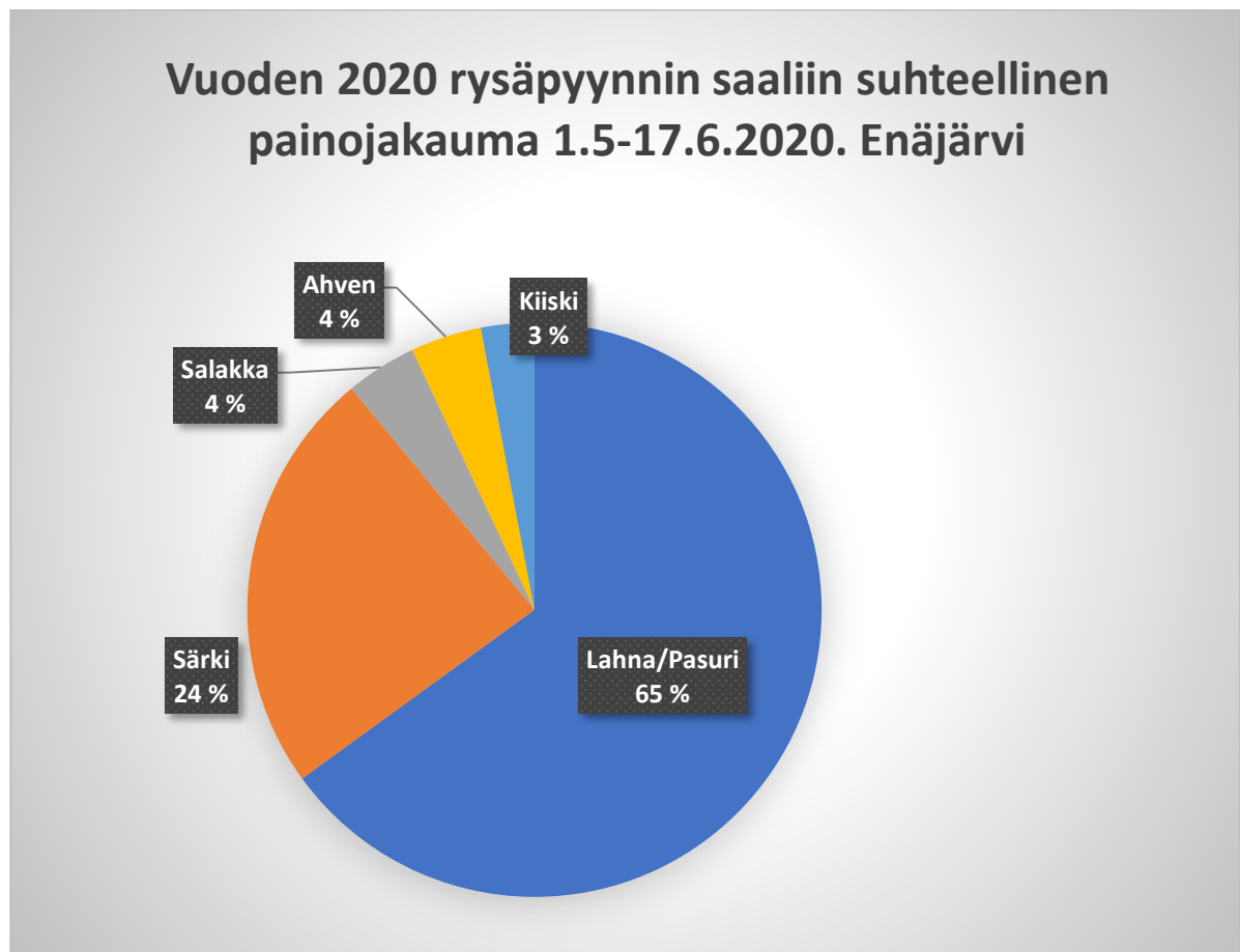
Kuva 1. Rysäpyyntijakso 1 Enäjärvellä. Kokonaissaaliin suhteellinen painojakauma.

Enäjärven ensimmäinen rysäpyyntijakso toteutettiin 1.5-17.6.2020, jolloin keskityttiin erityisesti lahnan kutupyyntiin. Kokonaissaalis oli 5 570 kg, joista vapautettuja arvokaloja oli 800 kg. Kuvassa 1 on esitetty saalisjakauma huomioiden vapautetut arvokalalajit. Saalisjakauma tukee vuoden 2019 koekalastuksen tuloksia. Valtalajina on pasuri ja lahna. Petokalakanta on Enäjärvessä hyvä.