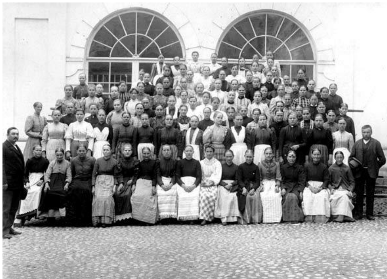
Tampereen Finlaysonin puuvillatehtaan työntekijöitä v.1890-luvulla.