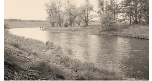
Kuva (ylh.) Loimijoki virtaa Vaulammin kylän läpi.