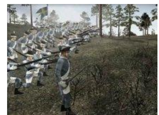
Kustaan sotaa käytiin vv. 1788-90 Savossa ja Uudellamaalla.