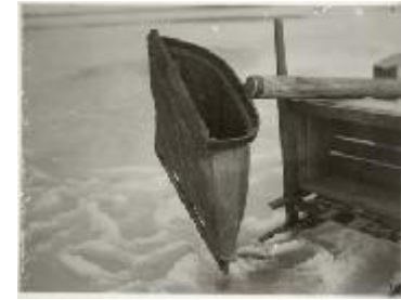
Könnön isännän järvimalmihaavi