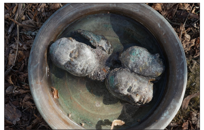
Kaisa Järvinen pronssiteos Pesuvesi.