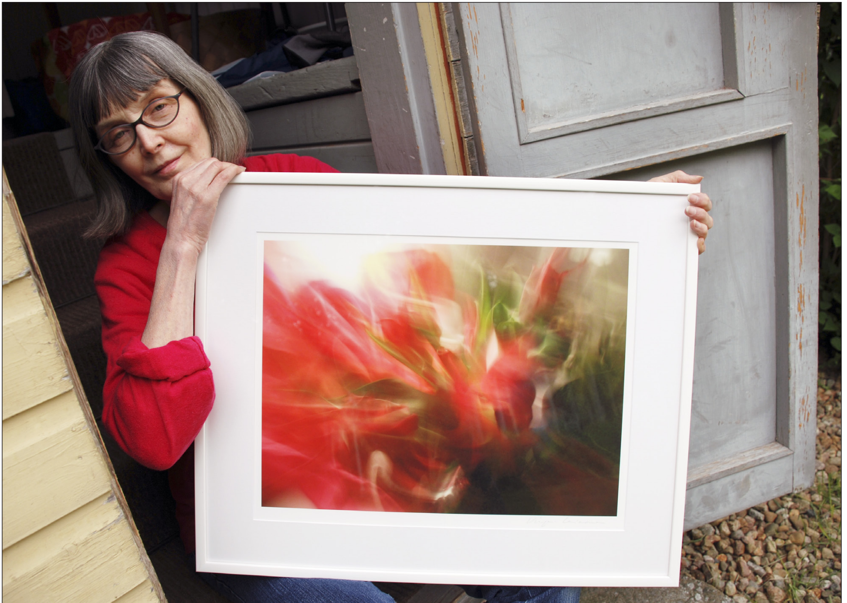
Valokuvataiteilija Virpi Leinosen teokset ovat täynnä puhtautta ja raikkautta.

Kuka? Mitä? Missä? Milloin? Sähköposti toimitus@shl.fi • puhelin (03) 539 9800.